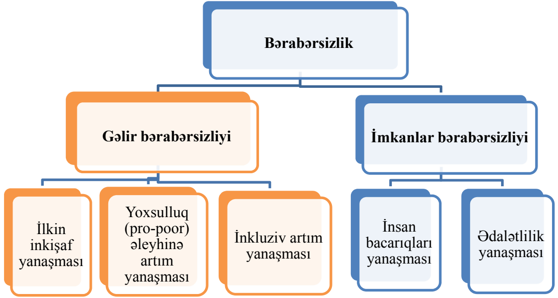
Şəkil 1. Bərabərsizlik anlayışına konseptual baxış (BMT, 2012)

Gəlirlər və imkanlar bərabərsizliyi bir qəpiyin iki əks üzleridir. Bərabərsizliyi azaltmağa yönələn inkişaf siyasəti həm gəlirlərə həm də imkanlara fokuslanmalıdır (BMT).